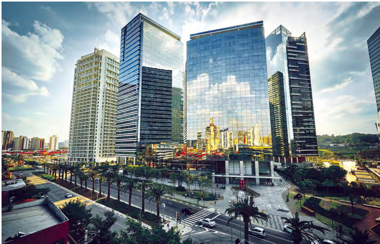
La zona de Berrini, central para los negocios en la ciudad.