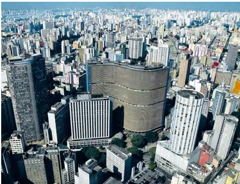
Vista de São Paulo.

este año se espera lograr la meta de inflación, que hoy está a mitad de camino.